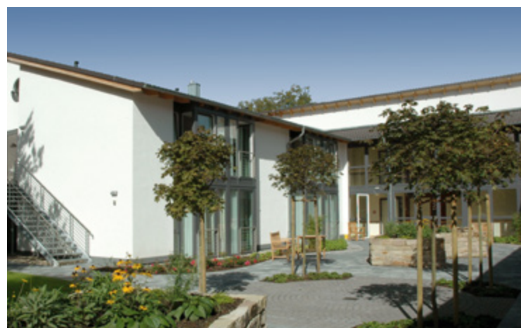
Pflegehaus | Kalletal

Der demografische Wandel zu einer immer älter werdenden Gesellschaft hat zur Folge, dass die Nachfrage nach Pflegeeinrichtungen stetig wächst. So hat auch die Baugesellschaft Sudbrack schon eine Vielzahl von Pflegeheimen mit unterschiedlichsten Gebäudekonzepten errichtet. Häuser mit verschiedenen Wohnbereichen wie Apartments oder Zimmern für alle Pflegestufen sind für uns kein Neuland – wir sind mit den speziellen Anforderungen, die der Bau einer Pflegeeinrichtung erfordert, vertraut.