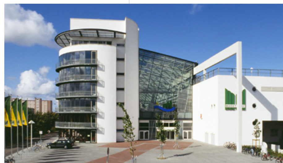
Warnow Park | Rostock