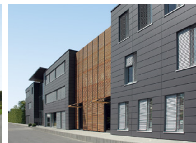
Gehring | Gütersloh