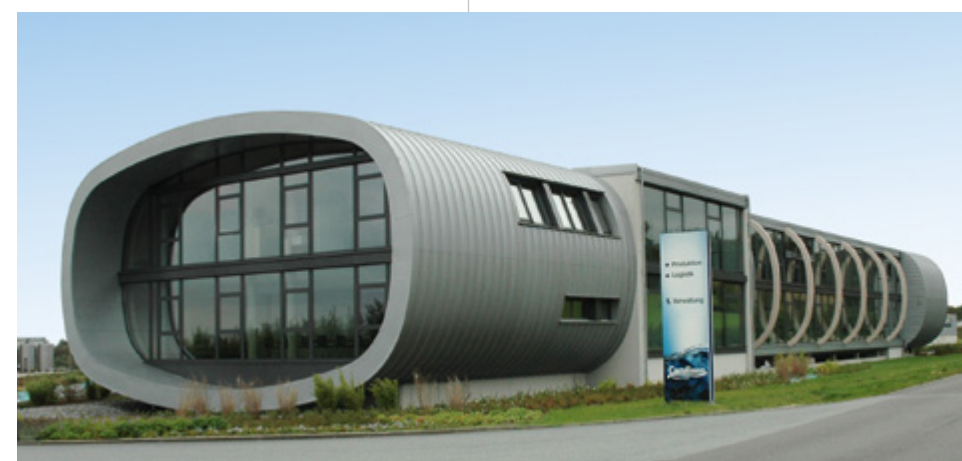
Carolinen Brunnen | Bielefeld