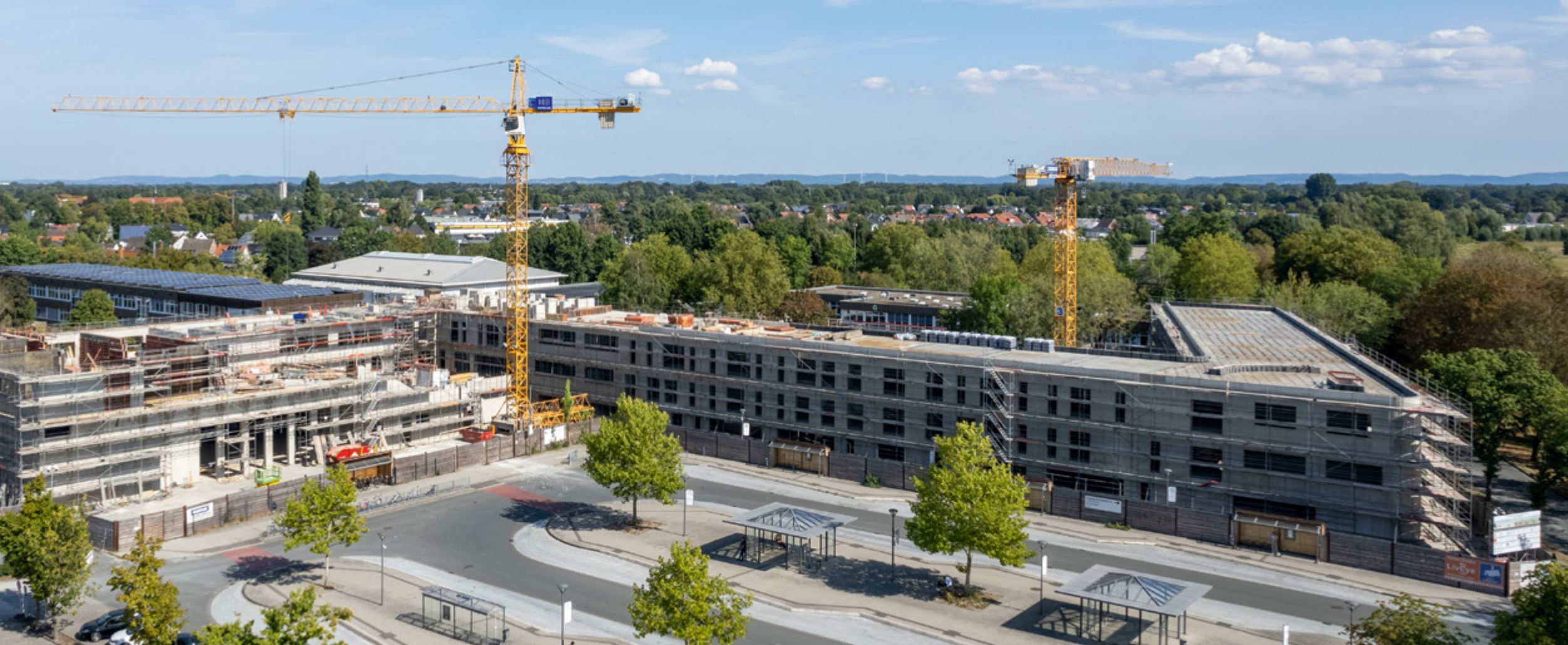
Gymnasium Nepomucenum | Rietberg