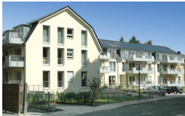
Am Meierteich | Bielefeld