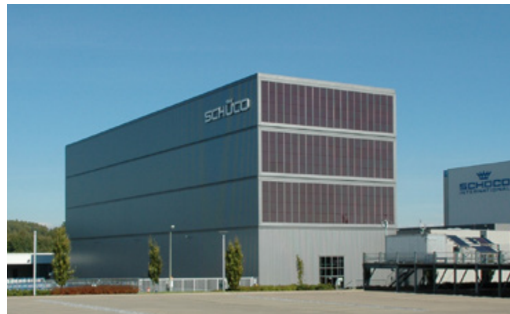
SCHÜCO | Bielefeld