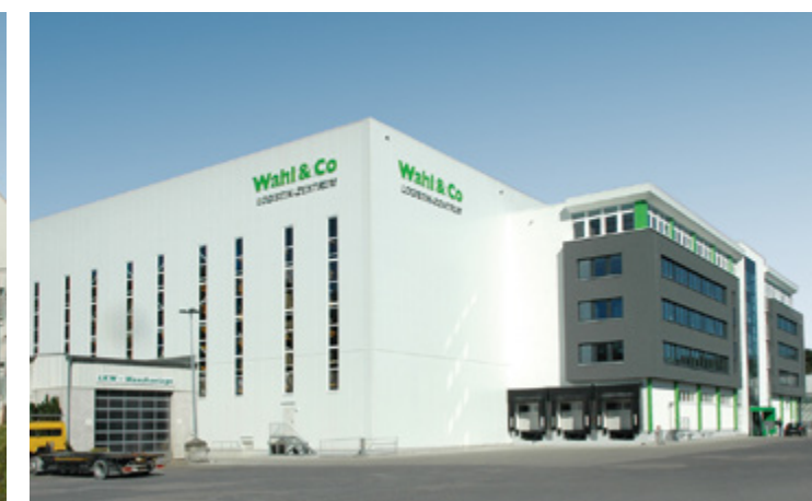
Wahl & Co | Bielefeld