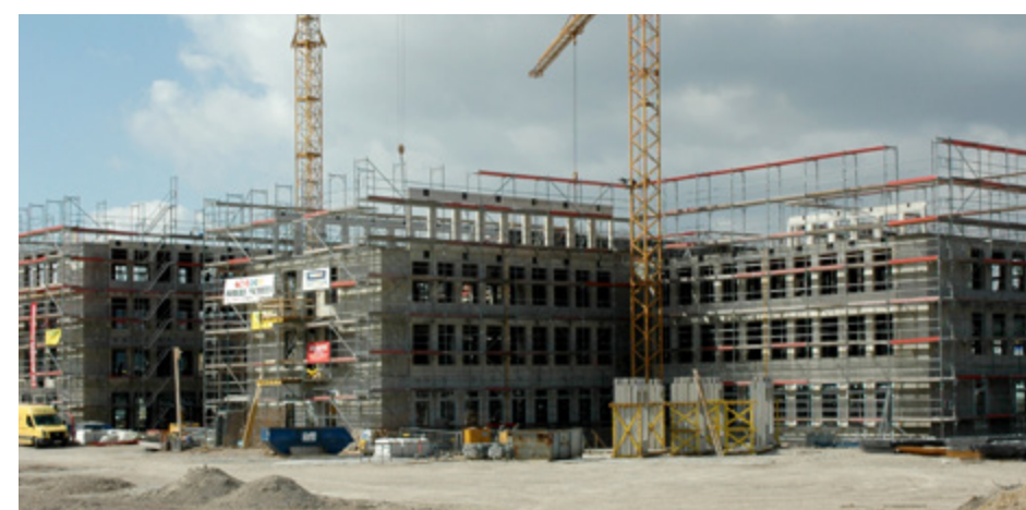
Jobcenter | Bielefeld

Es muss nicht immer alles aus einer Hand sein. Manchmal ist es sinnvoller, sich die besten Firmen für die verschiedenen Gewerke selbst zusammenzustellen. Rohbau können wir! Gerade wenn es kompliziert wird, ist unsere Erfahrung und Kompetenz gefragt, wie z. B. bei dem neuen Kinderzentrum Bethel. Für die Gründung des Rohbaus mussten 750 Ort-betonbohrpfähle in der Erde verbracht werden, um ein stabiles Fundament zu schaffen.