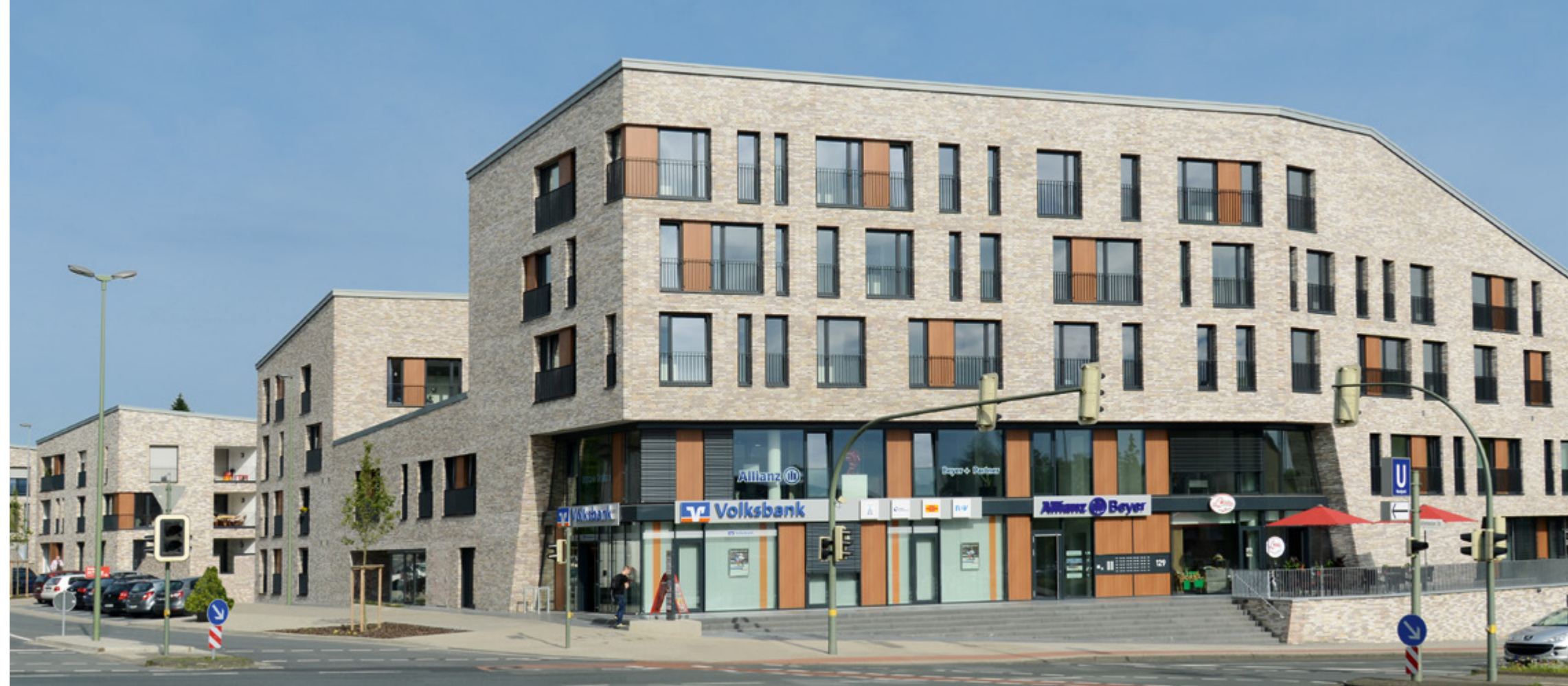
Jöllenbecker Straße | Bielefeld

Der Wohnungsbau hat in den letzten Jahren immer weiter an Bedeutung gewonnen, denn die Nachfrage nach Wohnraum ist ungebrochen hoch. Auch in diesem Bausektor kann die Baugesellschaft Sudbrack auf ein vielfältiges Portfolio verweisen. In enger Zusammenarbeit mit Investoren und Architekten entstehen Mehrfamilienhäuser, Wohnanlagen, Geschäftshäuser mit Wohnungen und Pflegeeinrichtungen. Wir bauen für Sie termingerecht, wirtschaftlich und immer auf dem neusten Stand der Technik.