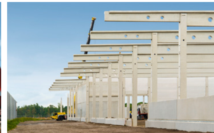
DEG | Dortmund