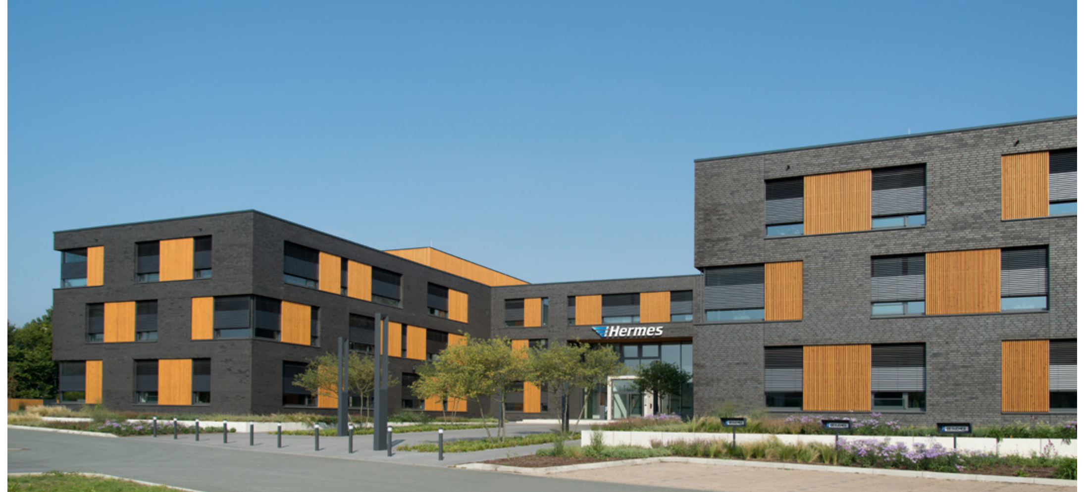
Hermes | Löhne

Das Verwaltungsgebäude und Schulungszentrum für den Hermes Versand wurde nach den Richtlinien der Deutschen Gesellschaft für Nachhaltiges Bauen zertifiziert (DGNB Gold). Das unter ökologischen Aspekten konzipierte Gebäude ist mit einer Geothermie-Anlage zur Beheizung und Kühlung (Betonkernaktivierung) ausgestattet. Die Versorgung der Anlage erfolgt über 75 Erdsonden in je 99 Metern Tiefe. Der anspruchsvolle Bau wurde von der Baugesellschaft Sudbrack schlüsselfertig inklusive Ausführungsplanung errichtet.