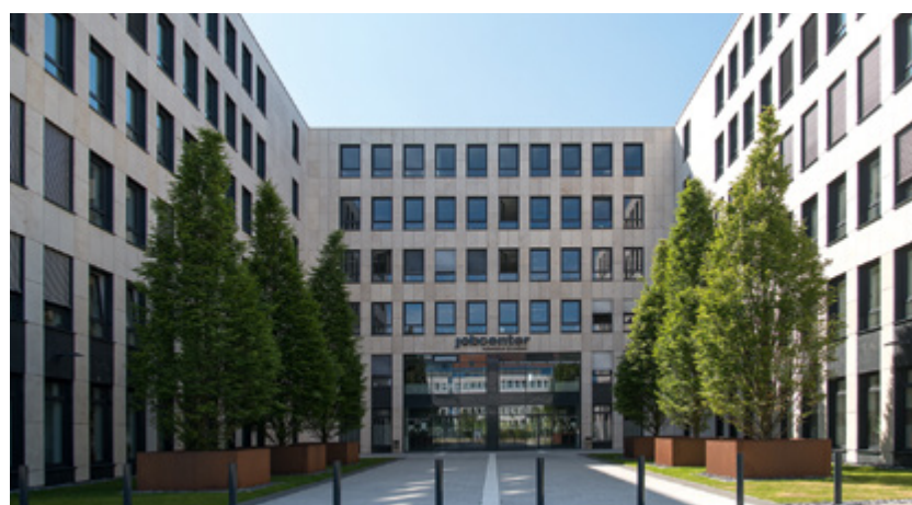
Jobcenter | Bielefeld

Verwaltungs- und Bürogebäude werden immer mehr zur Visitenkarte von Unternehmen. Es wird großer Wert auf eine individuelle Gestaltung und eine energetisch nachhaltige Bauweise gelegt. Im Mittelpunkt stehen moderne Räume, in denen sich die Mitarbeitenden wohlfühlen und sich mit ihrem Unternehmen identifizieren können. Wir planen und Bauen mit Ihnen im engen persönlichen Kontakt Ihr Wohlfühlbüro.