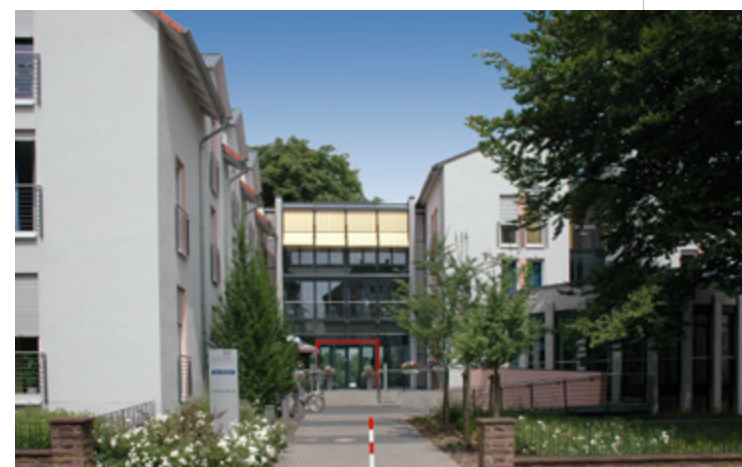
Haus Elisabeth | Herford