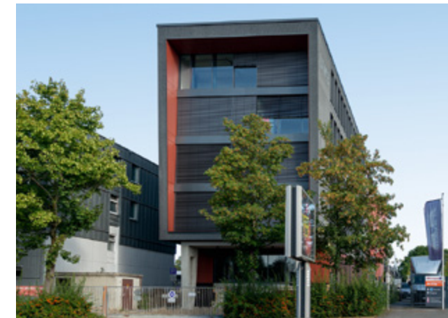
Umweltbetrieb | Bielefeld