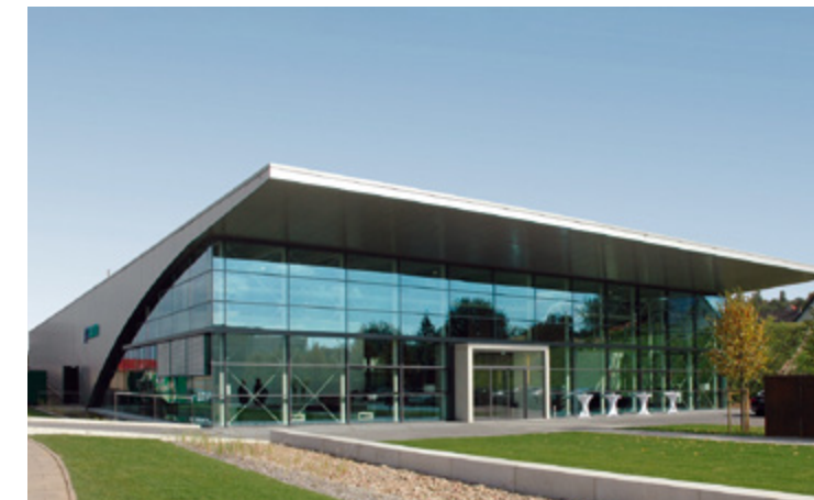
Pronorm | Vlotho