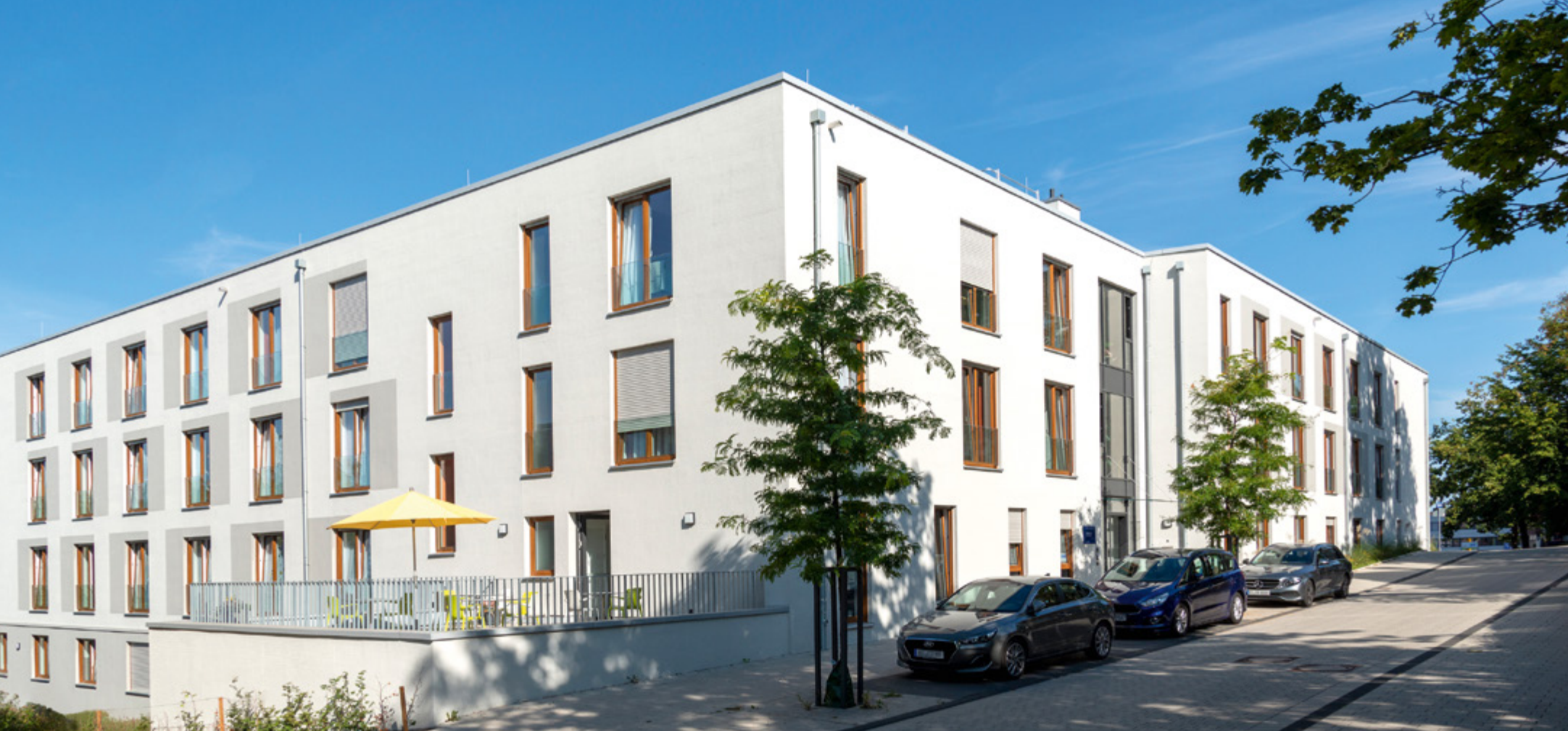
Haus Hannah, Bethel | Bielefeld