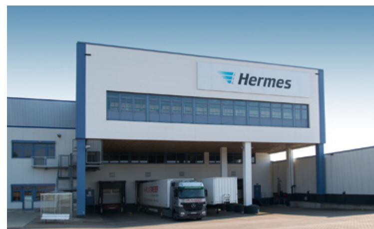
Hermes | Löhne