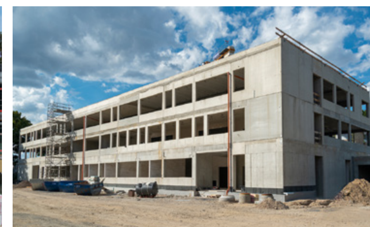
Stadtwerke | Detmold