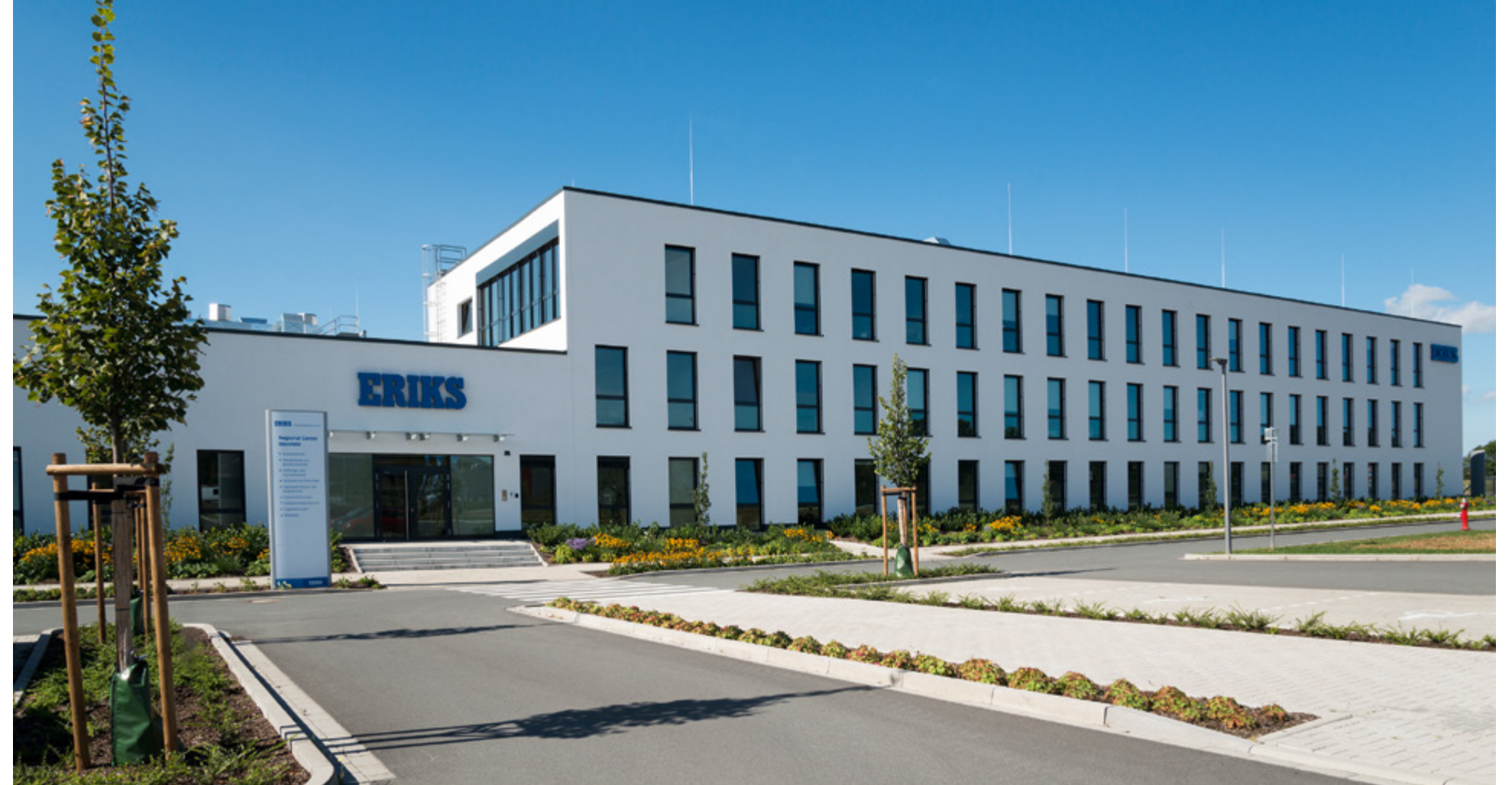
ERIKS | Halle (Westfalen)

Es sind vor allem mittelständische Unternehmen, die unsere Kompetenz beim Bau von Produktions- und Logistikhallen zu schätzen wissen. Von der einfachen Produktionshalle bis zum großen Logistikzentrum entwickeln wir maßgeschneiderte, individuelle Lösungen für alle Anforderungen und Branchen. Um wirtschaftlich und schnell zu agieren, arbeiten wir in den meisten Fällen mit Stahlbetonfertigteilen. Eine bewährte Technik, mit der unsere Ingenieure und Fachkräfte jahrelange Erfahrungen haben.