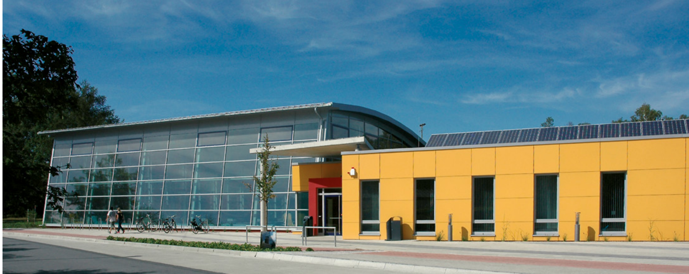
Sportbad | Bielefeld-Sennestadt

Alle Fußballfans kennen sie, die SchücoArena in Bielefeld und viele haben sogar schon einmal bei einem Spiel von Arminia Bielefeld mitgefiebert. Aber wussten Sie auch, dass sich unter ihren Sitzen eine Konstruktion aus Stahlbetonfertigteilen der Baugesellschaft Sudbrack befindet? Wir haben vor fast zwanzig Jahren die Erweiterung des Stadions, die einem Neubau gleich kam, mit den Spezialisten unserer Fertigteileabteilung realisiert. Wenn Sie nicht nur zuschauen, sondern selbst aktiv werden wollen, dann gehen Sie schwimmen! Von Bielefeld bis Paderborn haben Sie z. B. die Auswahl zwischen drei schicken Hallenbädern, die von uns gebaut wurden. Überzeugen Sie sich selbst von der Qualität dieser Bauten.