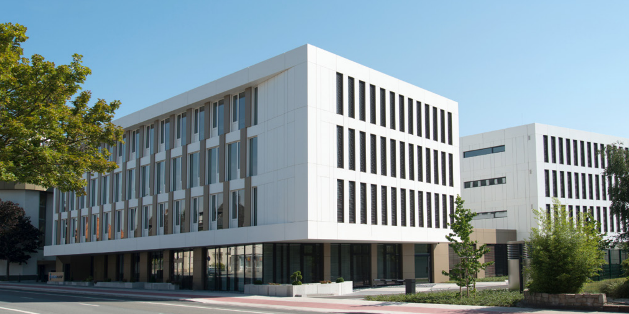
Beumer Group | Beckum