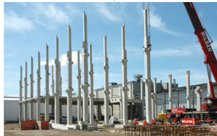
Teekanne | Düsseldorf