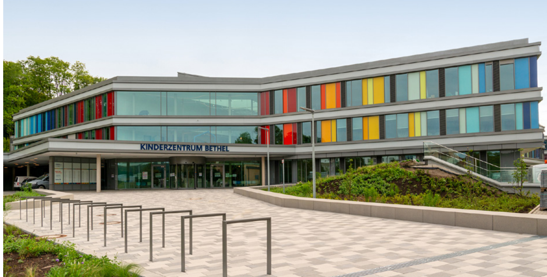
Kinderzentrum Bethel | Bielefeld