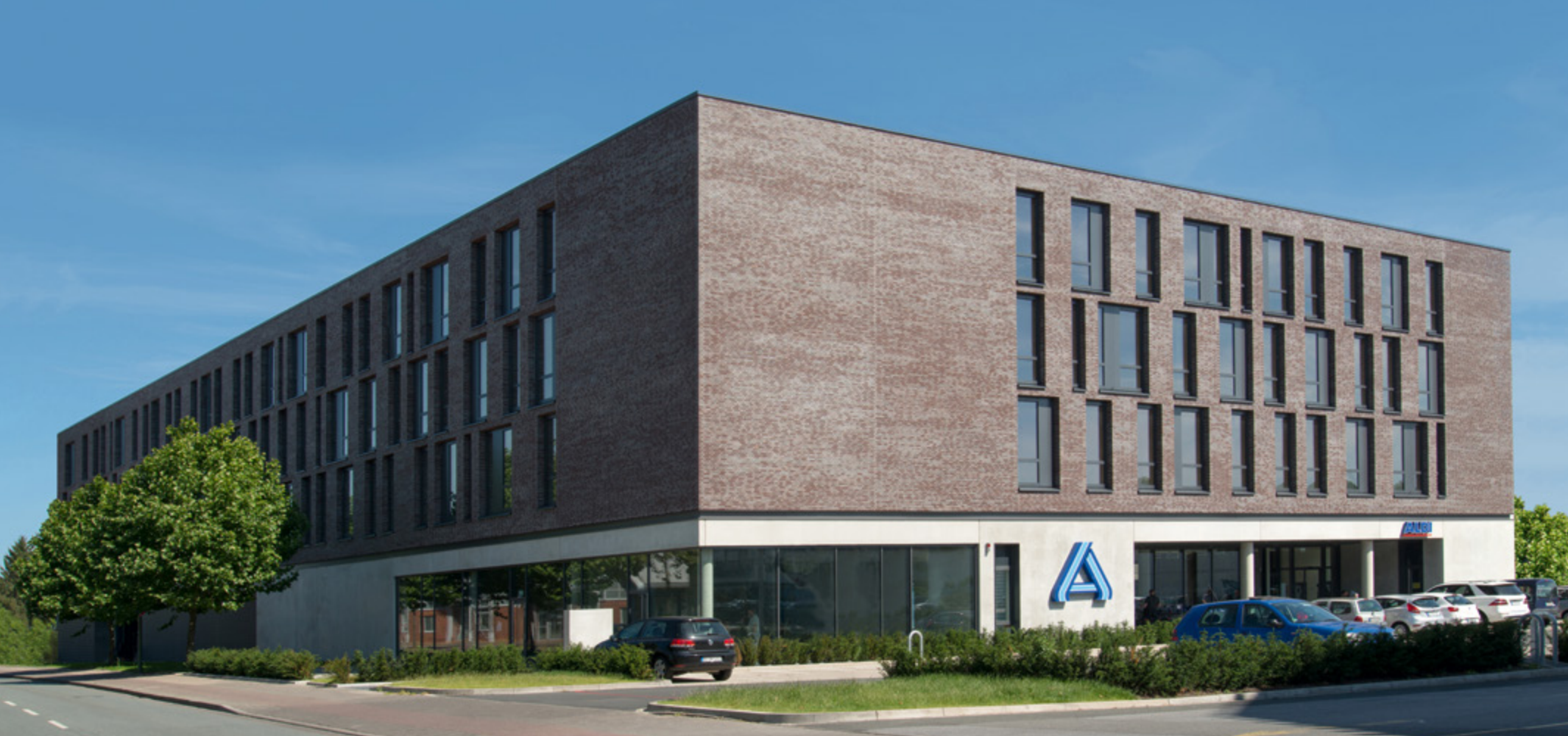
Aldi | Bielefeld

Mit zahlreichen Unternehmen aus der Lebensmittelbranche, wie z. B. Plus, Aldi oder Marktkauf, verbindet uns eine langjährige Partnerschaft. Unsere Auftraggeber aus dem Handel schätzen unsere termingenaue und qualitativ hochwertige Arbeit. Neben Lebensmittelmärkten bauen wir auch große Einkaufszentren wie z. B. den Lausitz Park in Cottbus, den Warnow Park in Rostock oder das Ruhrtal Center in Wetter. Für solche komplexen Bauvorhaben bieten wir ein qualifiziertes Projektmanagement und ein gut eingespieltes Team von Spezialisten.