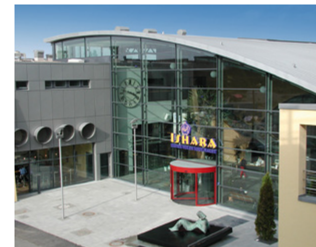
Ishara Bad | Bielefeld