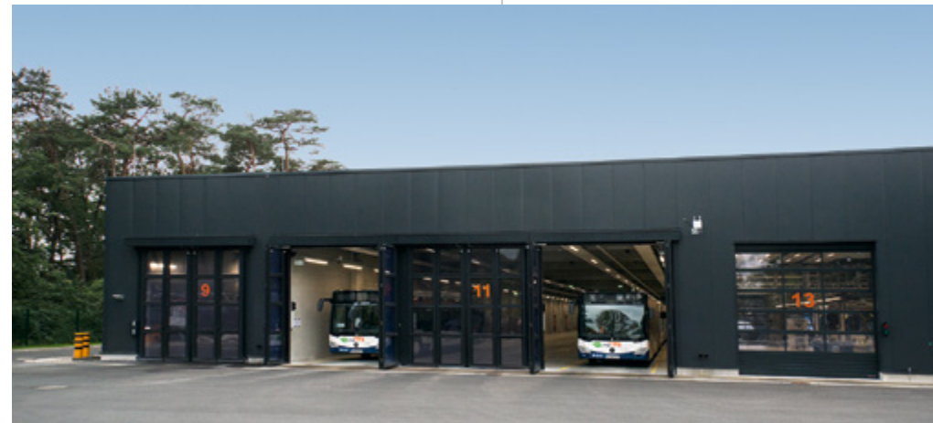
moBiel Busbetriebshof | Bielefeld