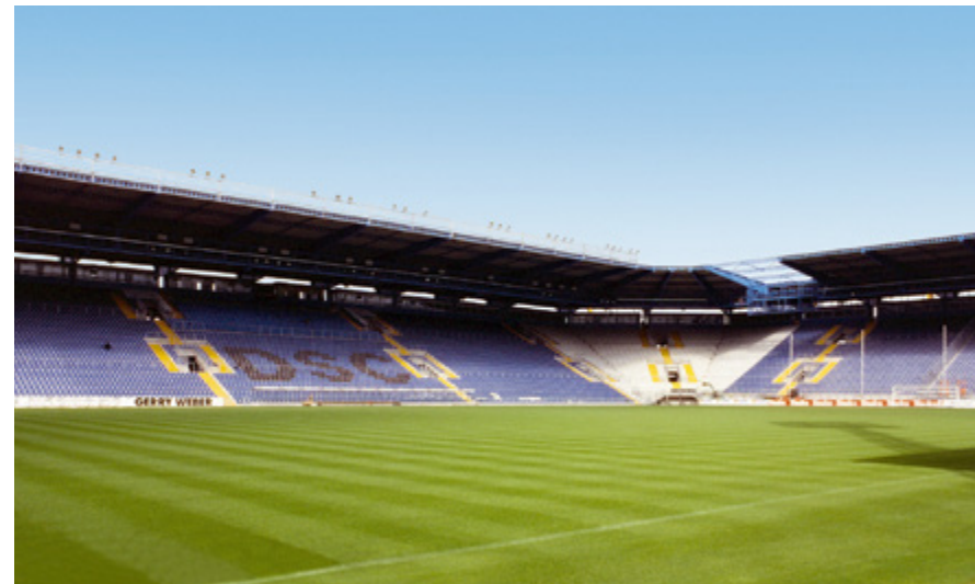
SchücoArena | Bielefeld