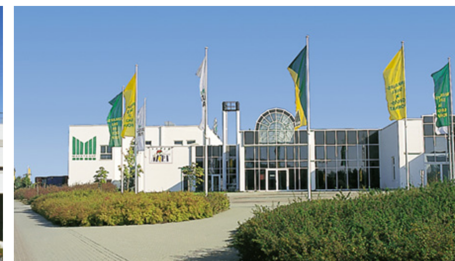
Lausitz Park | Cottbus