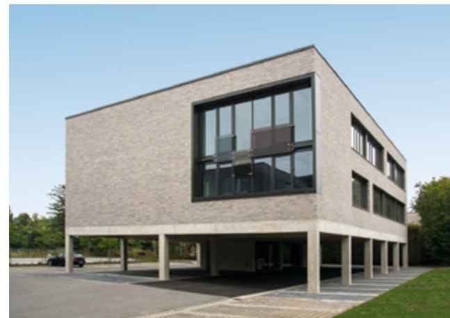
Osthushenrich Stiftung | Halle in Westfalen