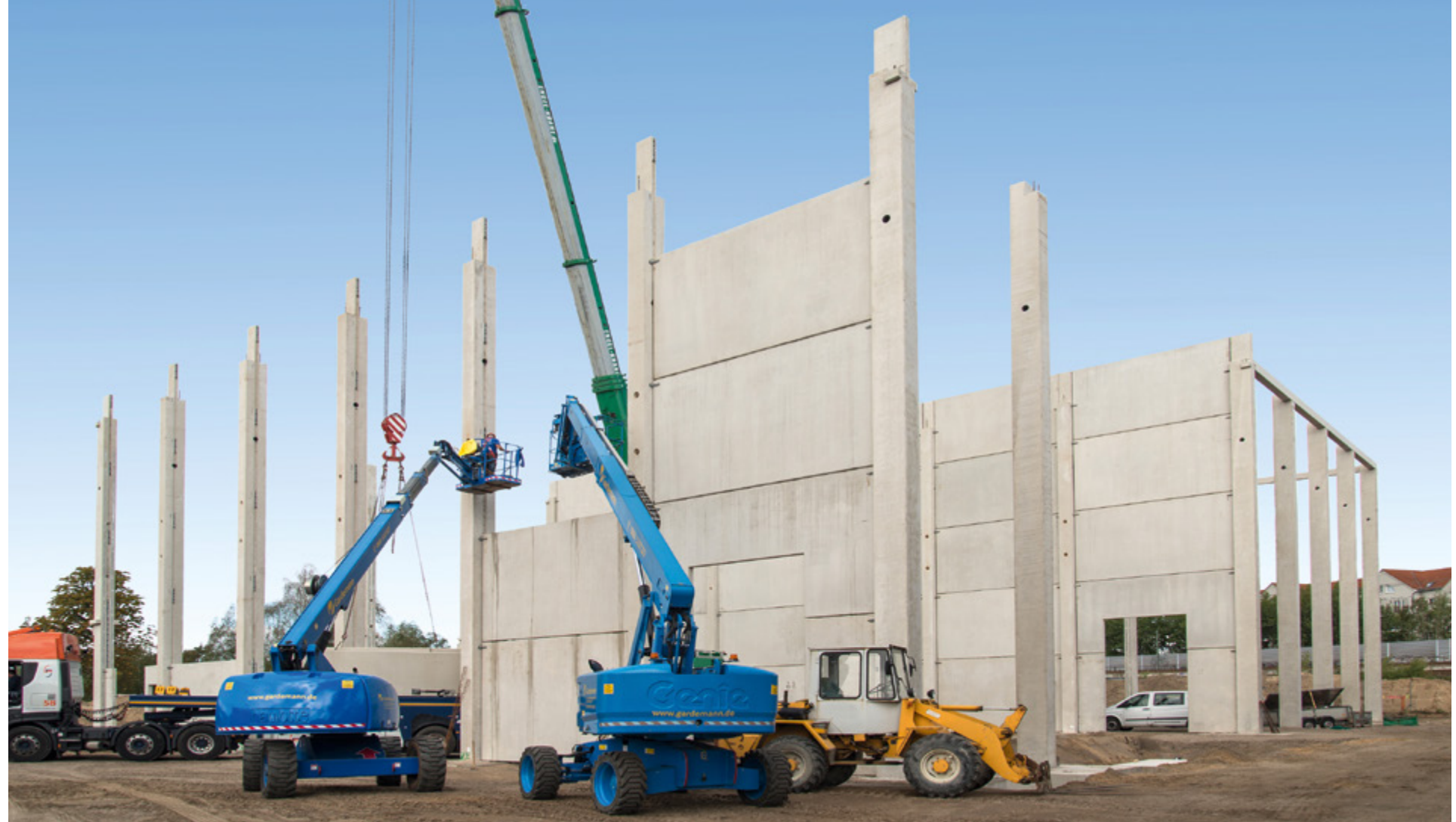
DeWiBack | Berlin

Das Bauen mit Stahlbetonfertigteilen ist eine Kernkompetenz von uns! Jedes Jahr bauen wir mehrere Produktions- und Logistikhallen. Durch die rationelle und qualitativ hochwertige Vorfertigung der Bauelemente lassen sich Bauvorhaben termingerecht und wirtschaftlich durchführen. Planung und Statik werden von unseren Ingenieuren erstellt. Für den Aufbau sorgen unsere erfahrenen Montageteams. Lassen Sie sich von uns beraten, welches Bausystem für Sie das beste ist.