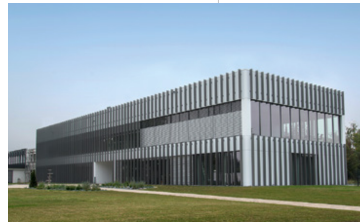
Plasmatreat | Steinhagen