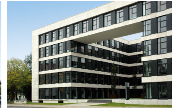
Borchard + Dietrich | Bielefeld