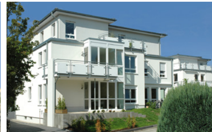
Herrenkamp | Bielefeld