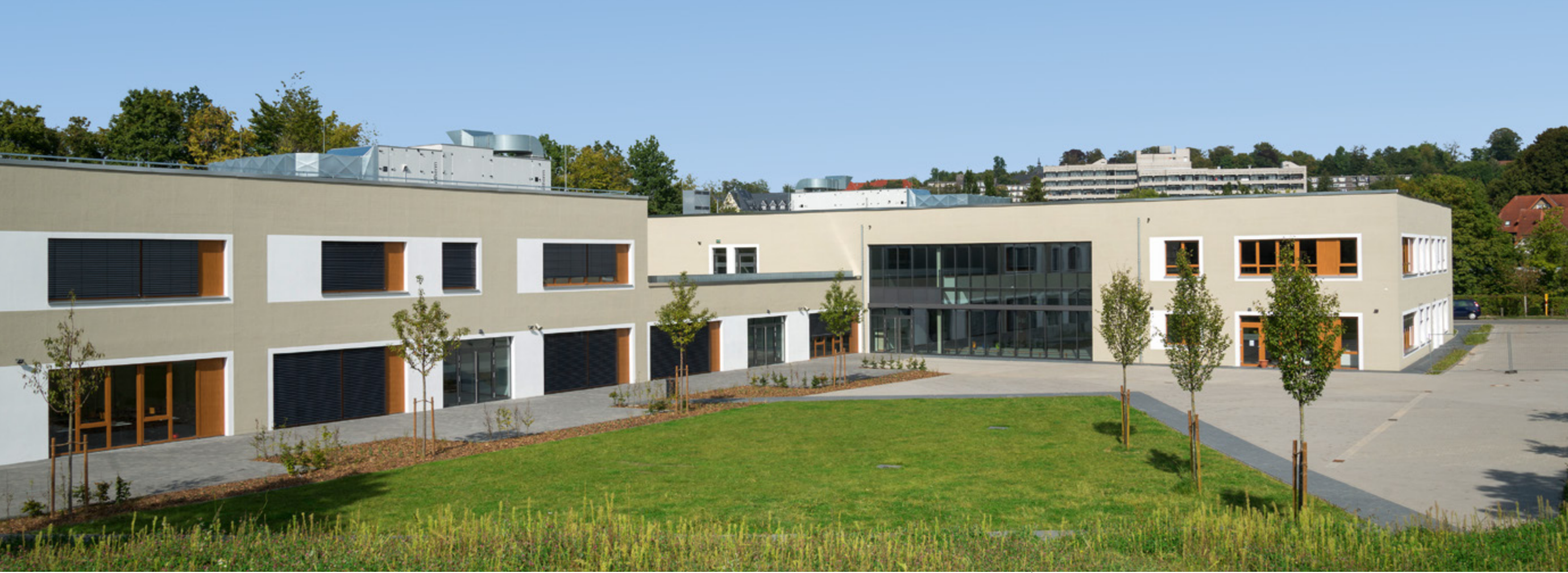
Sekundarschule Bethel | Bielefeld