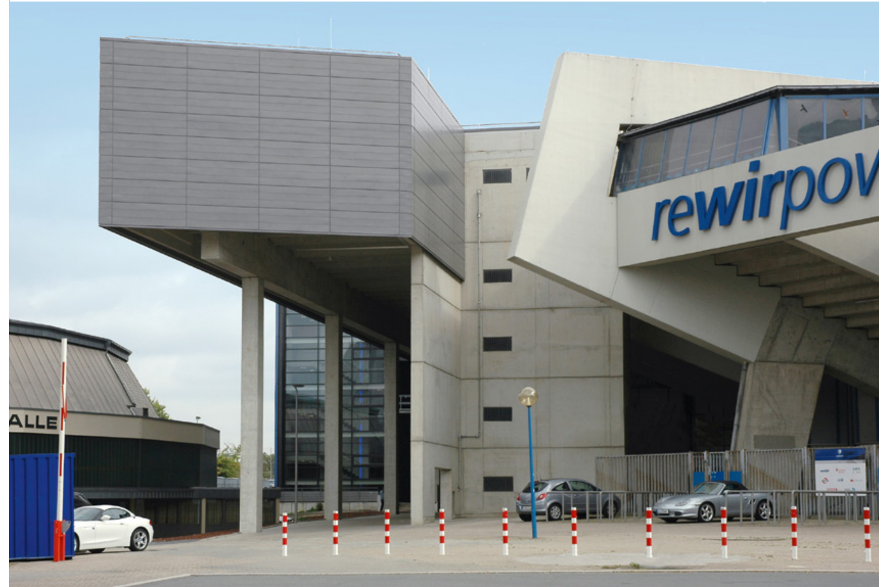
rewirpower-Lounge | rewirpowerstadion | Bochum