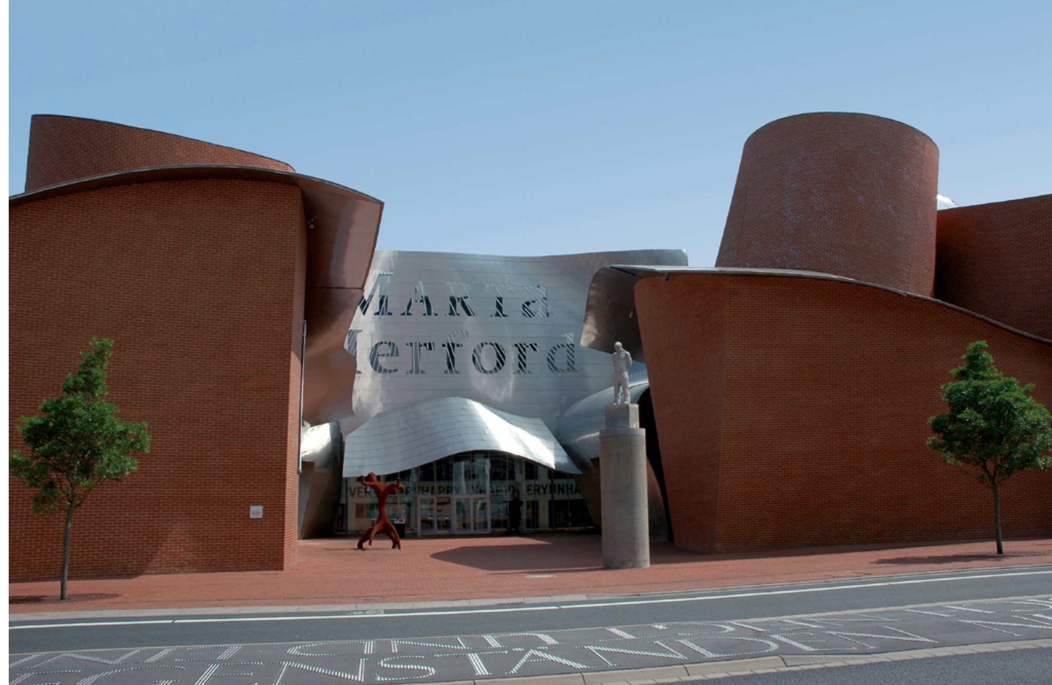
Museum MARTa | Herford