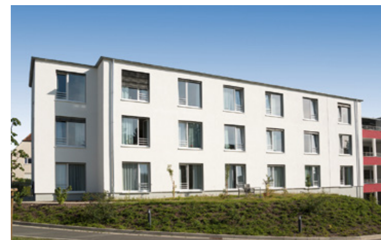
Marswidisstift | Bielefeld