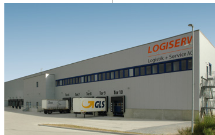
Logiserv | Bönen