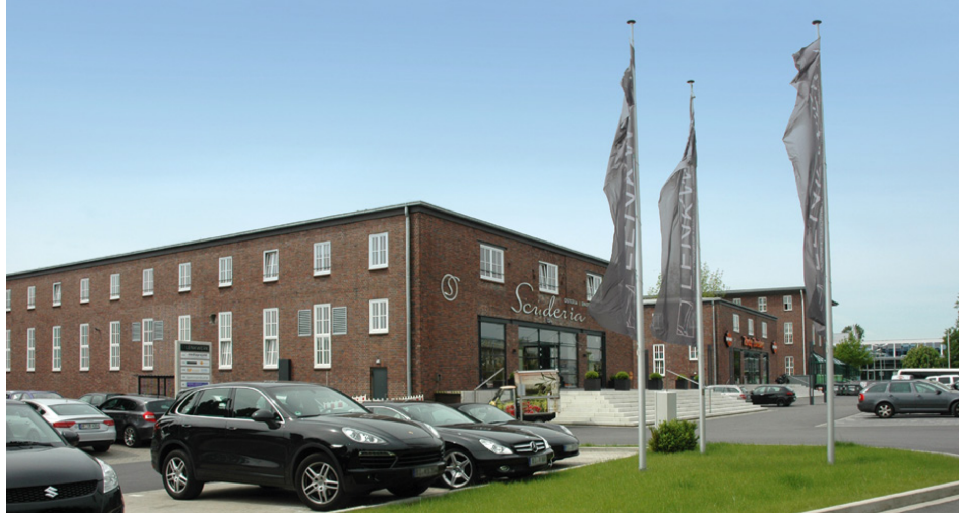
Lenkwerk | Bielefeld