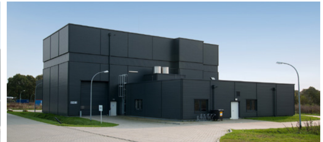
XFEL | Hamburg-Schenefeld