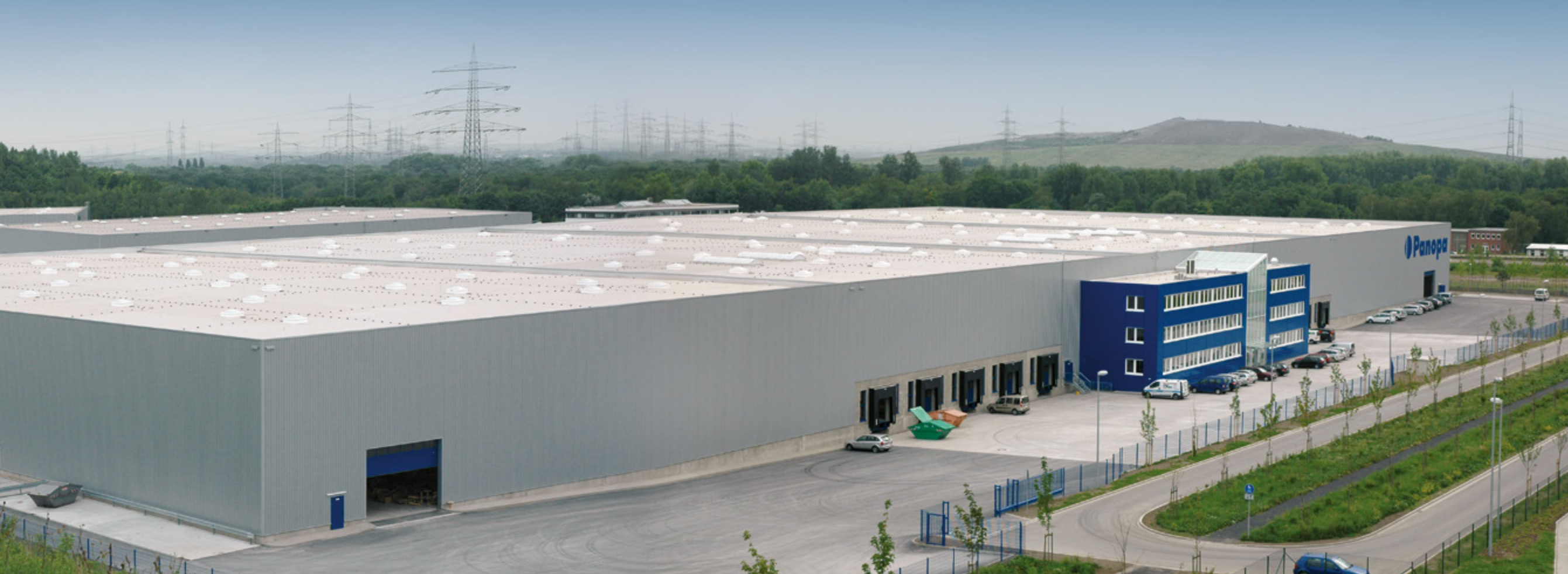
Panopa | Hertzen