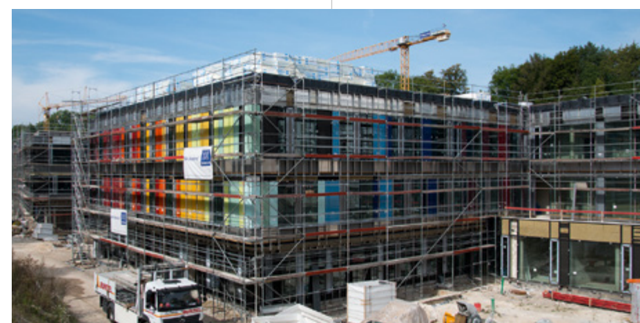
Kinderzentrum Bethel | Bielefeld