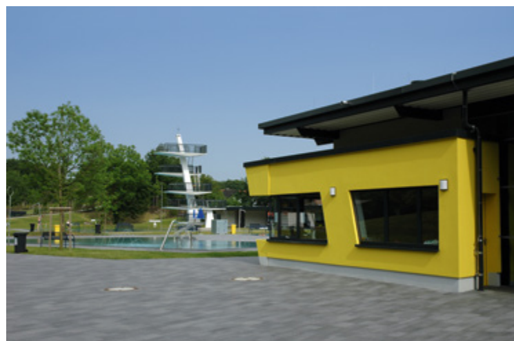
Rolandsbad | Paderborn