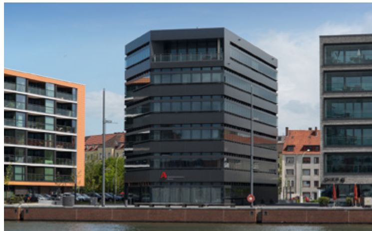
Arbeitnehmerkammer | Bremen