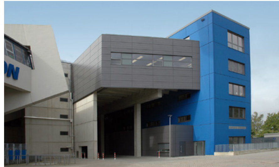
rewirpower-Lounge | rewirpowerstadion | Bochum