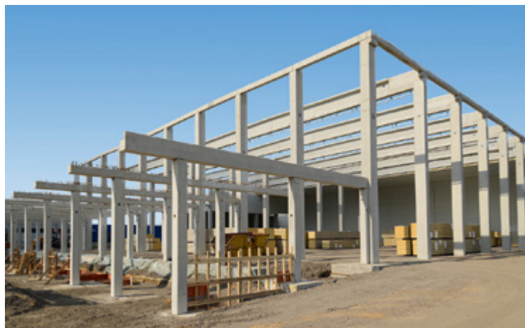
Tiefkühlhaus | Marl