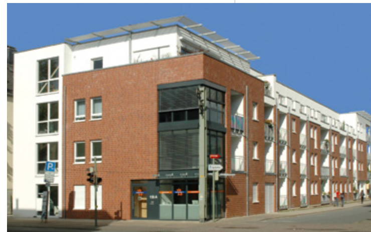
Carl-Schmidt-Straße | Bielefeld