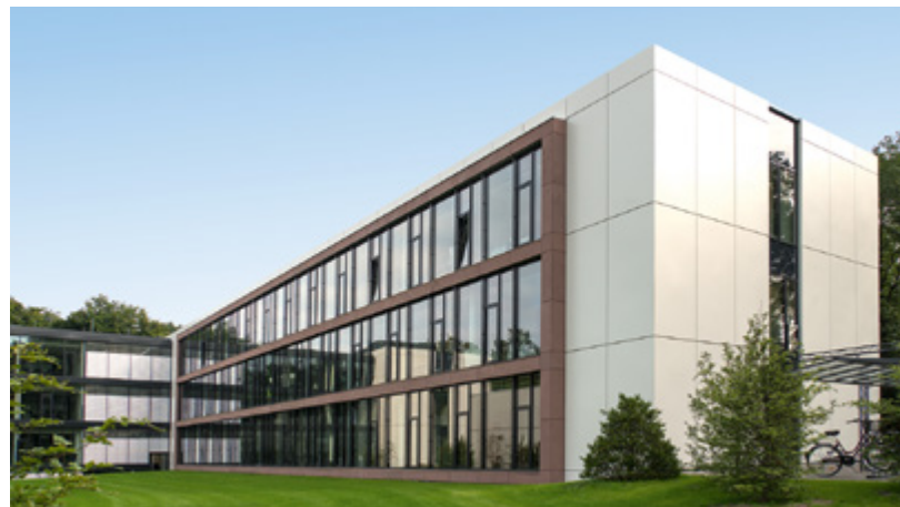
Storck AG | Halle in Westfalen