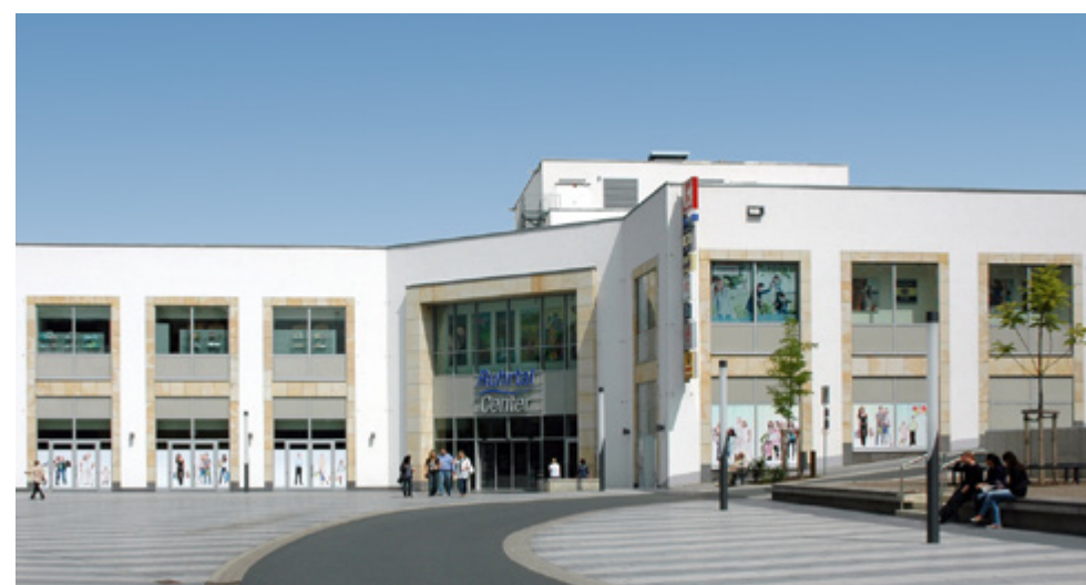
Ruhrtal Center | Wetter